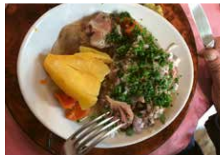
LA TÊTE DE VEAU